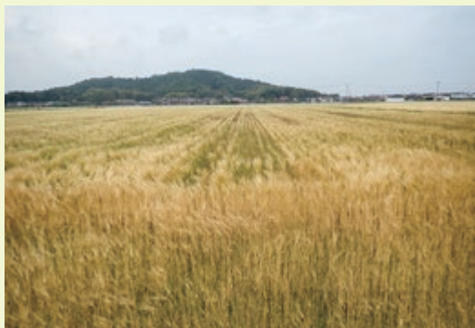
湿害による生育不良