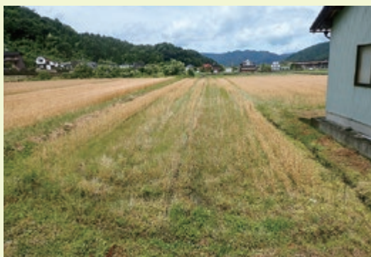
湿害による生育不良